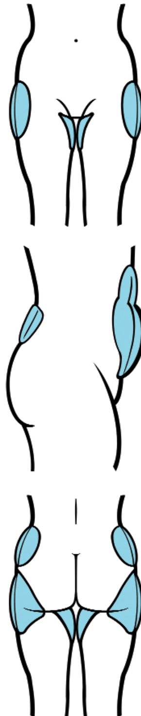
Abb. 3_ Problemzonen an Ober- und Unterbauch, Po und Hüften, für die sich die Ultraschall-Fettauflösung besonders eignet.